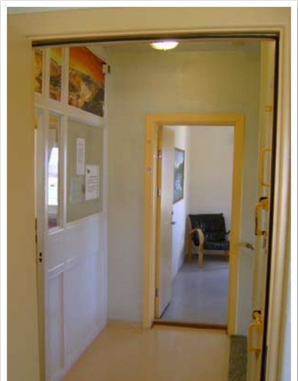
Komið inn í heimsóknaraðstöðu á Litla-Hrauni

Heimsókn í fangelsi er alltaf þungbær og vekur upp sárar tilfinningar. Heimsóknin dregur fram vanmátt fólks gagnvart aðstæðum sem ekki verður undan vikist. En heimsóknin er jákvæð vegna þess að fanginn og fjölskylda hans finna það sem mestu máli skiptir í lífinu í öllum aðstæðum: væntumþykjuna og það hversu dýrmætt frelsið er. Hvort tveggja verður gott veganesti þegar út er komið.