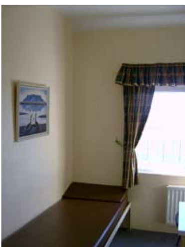
Úr einu af mörgum heimsóknarherbergjum á Litla-Hrauni.