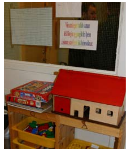
Á ganginum eru leikföng sem börn geta tekið með sér inn á gestaherbergin.