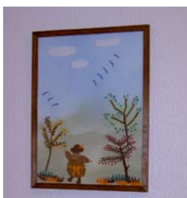
Kveðjastundir geta verið sárar.