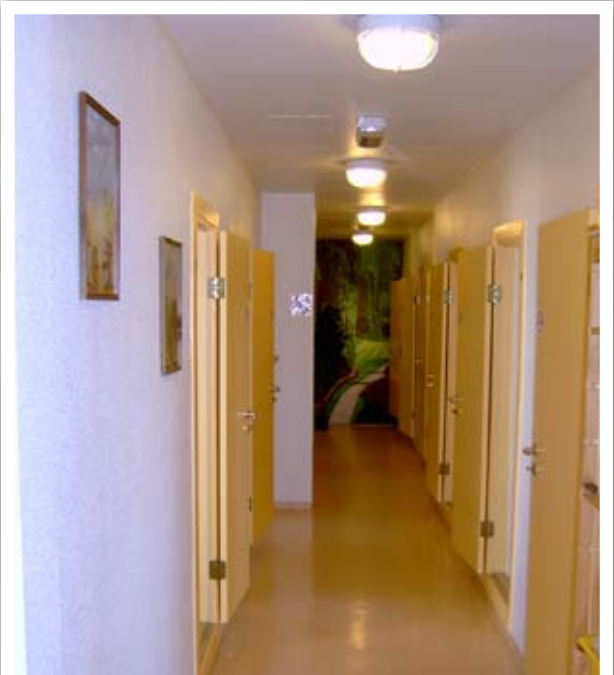
Heimsóknargangur á Litla-Hrauni

Beint af augum er stærra fjölskylduherbergið.