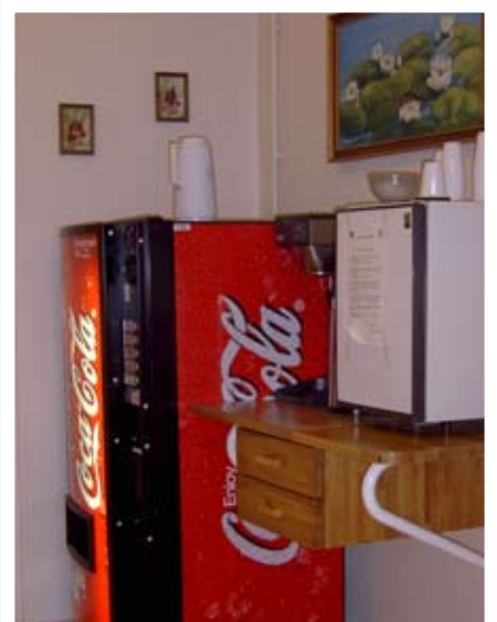
Hægt er að kaupa sér gos og sælgæti auk þess sem boðið er upp á kaffi.