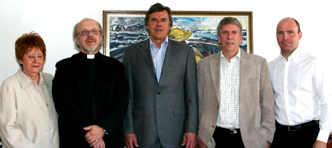
Myndin var tekin eftir undirritun samkomulags Verndar og Fangelsismálastofnunar.