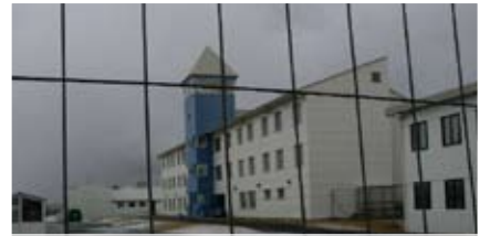
Gengið er inn skammt frá útvistarsvæði fanga til þess að komast að gestamóttökunni á Litla-Hrauni.