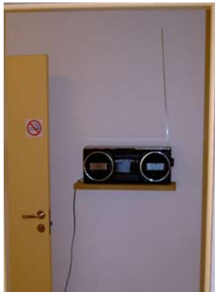
Ljúfir tónar berast frá útvarpstækini á heimsóknarganginum.