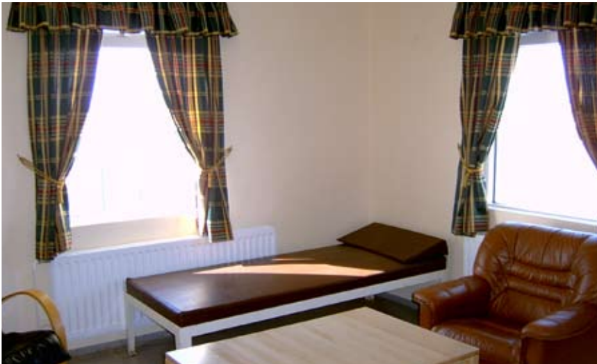
Stærri fjölskylduherbergið á Litla-Hrauni.