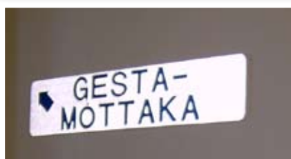
Allar merkingar í gestamóttöku eru samskonar og notaðar eru í bílnúmeraplötur en þær eru framléiddar af föngum á Litla-Hrauni.